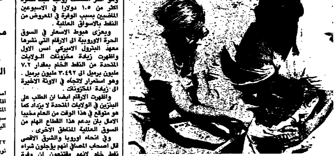
أسعار طلع يعاني من سوء التغذية في مالي

تهدد المجاعة اكثر من ثلاثين مليون رجل وامرأة وطفل بصورة مبرحة. ويعد صيحة التحذير التي اطلقتها منظمة الامم المتحدة للاغذية والزراعة في ١٠ ايار الحالي وتحتية قمة الدول السبع الصناعية في بون الايسر.